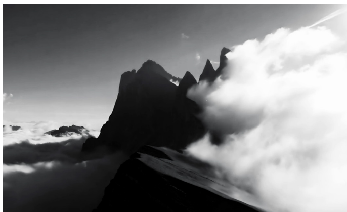
La Nature, Artavazd Pelechian

La Fondation Cartier pour l'art contemporain a le plaisir d'annoncer la présentation exceptionnelle de La Nature , le dernier film du légendaire réalisateur arménien Artavazd Pelechian, et la première mondiale de 2 Pasolini , le nouveau film du cinéaste roumain Andrei Ujica, au 59 ème Festival du film de New York (24 Septembre – 10 Octobre 2021).