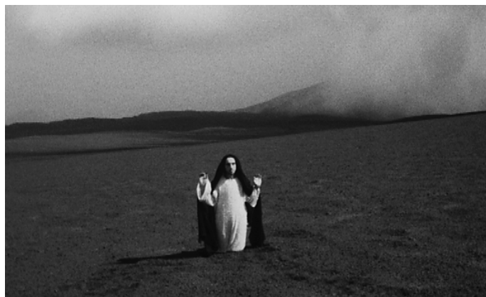
2 Pasolini

La Nature (2020) d'Artavazd Pelechian a été produit par la Fondation Cartier pour l'art contemporain et le ZKM Filminstitut avec le soutien de la Folk Arts Hub Foundation.